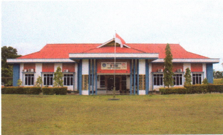
Gambar 2. Gedung Kantor UKPBJ Kepri